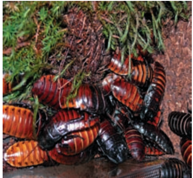
Fauchwanz aus dem Lebendtier-Bereich der Ausstellung

„GONDWANA – Das Praehistorium“ wird genau diesem Muster folgen. Es wird verständlich, erlebnisreich und wissenschaftlich fundiert erklärt, wie sich Organismen und Lebensgemeinschaften über mehr als 4 Milliarden Jahre Lebensgeschichte auf unserem Planeten entwickelt und verändert haben.