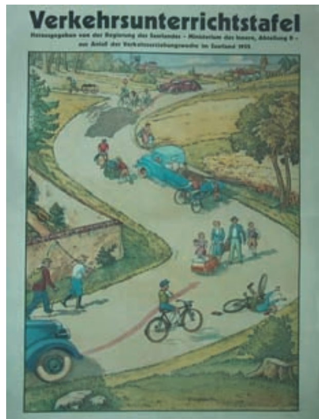
Abbildung einer Schulwandtafel aus dem Saarländischen Schulmuseum Ottweiler

Um die Bandbreite und Vielfältigkeit der Archivierung mit DigiCult zu demonstrieren, folgen anschließend einige Bilddokumente. Hierbei wurde ausschließlich auf Exponate zurückgegriffen, die aus bereits besuchten Museen stammen und im Rahmen der DigiCult-Arbeiten erfasst worden sind.