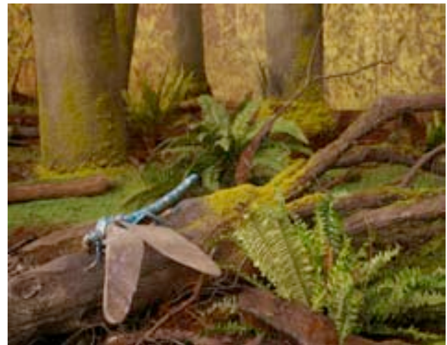
Exponat aus der Ausstellung „Kohle“

„Kohle schafft Land - Land schaf(f)t Kohle“ - Der Titel der noch bis Juni 2008 im ehemaligen Zechegebäude des Bergwerks Landsweiler-Reden laufenden Ausstellung ist ein hintergründiger Verweis auf ebenso komplexe wie vielfältige Inhalte. Es geht nicht nur um Kohle im Sinne ihrer Entstehung und der Lebensreste, die in ihr enthalten sind. Es geht auch um Landschaft, deren Entwicklung und Veränderung, und es geht um die vielseitigen Beziehungen zwischen Menschen und dem Naturrohstoff Kohle, ob bergbaulich, wirtschaftlich, geschichtlich oder kulturell. Eingebettet ist die Kohle-Ausstellung in das grenzüberschreitende Ausstellungsprojekt „Best of Nature“. Sieben Einzelausstellungen leisten dabei in Luxemburg, Frankreich und Deutschland ihre Beiträge zur Darstellung Luxemburgs und der Großregion im Rahmen der Aktivitäten zur europäischen Kulturhauptstadt 2007.