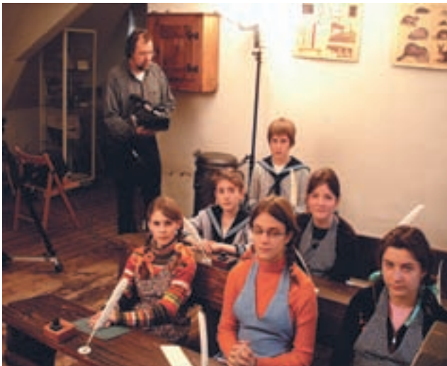
Ausschnitt aus der DVD des Schulmuseums

In Spielszenen und mit Exponaten des Saarländischen Schulmuseums werden vom Mittelalter bis in die jüngere Vergangenheit Schreibwerkzeuge, Lernhilfen und Vermittlungsstrategien zum Erlernen dieser von manchen als schwer empfundenen Kunst gezeigt.